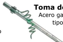
Toma de tierra Acero galvanizado tipo UTE