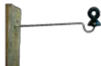
Soporte Línea Madre Para proteger alambrado convencional.