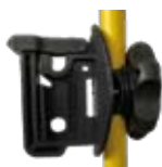
Aislador Multiuso para varilla