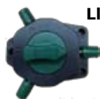
Llave de corte 3 posiciones Interruptora, para sectorizar el alambrado eléctrico.