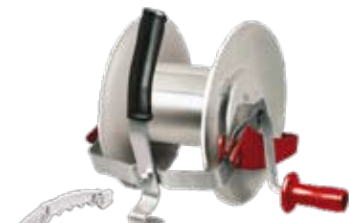
Con Multiplicador 3:1 -Incluye gancho ZAMMR.-