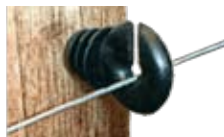
De poste con tornillo Permite recuperar el aislador después de su uso.