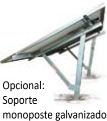
Opcional: Soporte monoposte galvanizado

Usos: Bebederos para ganado, tanque australiano, tanque elevado, sustitución o complemento de molinos, casas, escuelas, obras aisladas. Extracción de pozos o embalses.