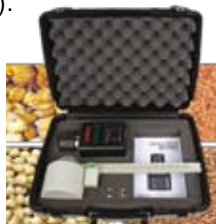
Kit con balanza Ph