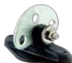
Aislador Derivador Ideal para porteras.