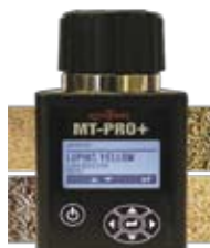
MTPRO+ y MTPRO