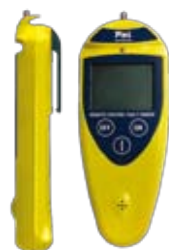
Control Remoto Fault Finder PEL