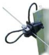
Doble Pinlock: Especial para piques/postes "Y"