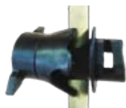
Regulable Para varillas de 6 a 16 mm de diámetro. Con rosca.