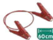
Puente conexión con pinzas cocodrilo en acero inoxidable.