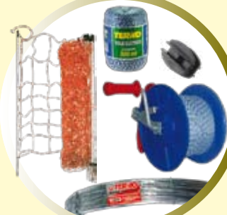
ACCESORIOS ALAMBRADO ELÉCTRICO