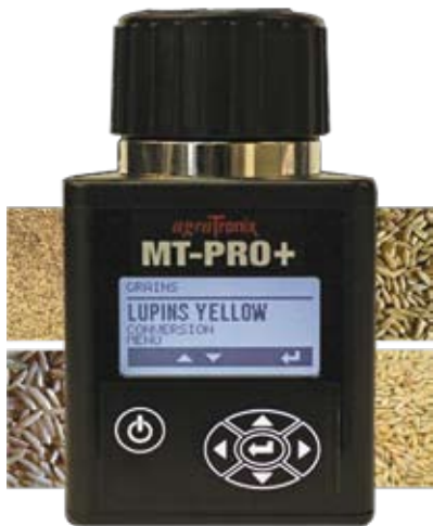
2 modelos: MTPRO+ y MTPRO