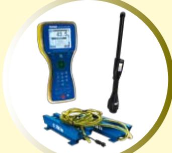
BALANZAS Y TRAZABILIDAD