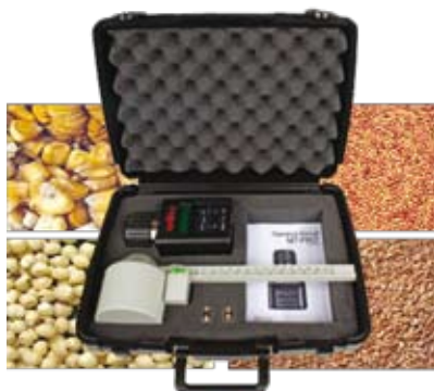
Kit con balanza Ph