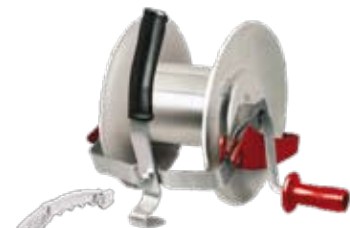
Con Multiplicador 3:1 -Incluye gancho ZAMMR.-