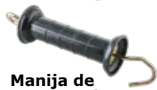
Manija de compresión Super reforzada. Más grande, más fuerte.